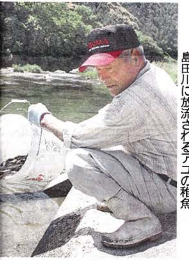
島田川に放流されるアユの稚魚

つていたが、誤りに気付かなかった。市は原因について業者から今後聞き取る方針という。「当該者にはおわび文を出した。職員のチェック体制も高めていきたい」と話している。(竜毛明日香)