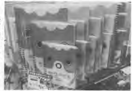
新商品のリングノート

つくれる文具屋さん 地元柳井市の民芸品 を標ぼうする(株)木阪賞 「金魚ちようちん」を 文堂(木阪泰之代表取 モチーフにしたオリジ 締役)は、山口県を代 ナル・リングノートと 表するまでに成長した 金魚ちようちん祭り20 周年を記念し て販売。地元 市長が購入し 話題となり、 売れ行き好調 だ。 同社では、 金魚ちようち んをモチーフ にした文具、 雑貨を毎年3 〜5アイテム 新規開発・制