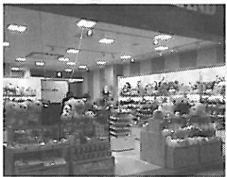
無料ダウンロードサービスは、ワールドアイ公式ホームページから利用できる。スヌーピータウンショップ(上)とキティランドを出店